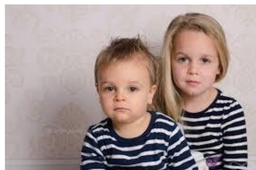
FRERE ET SOEUR