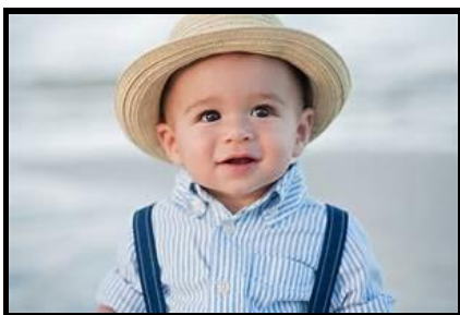
Le petit garçon

L'enfant nomme les étiquettes dans l'ordre pour créer une phrase.