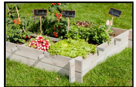
dans le potager