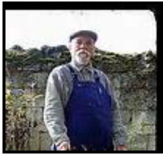
Le monsieur ou le jardinier