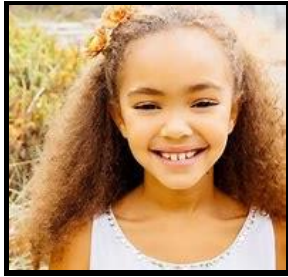
La petite fille