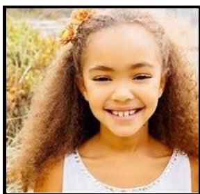
La petite fille