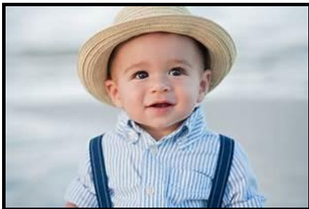
Le petit garçon