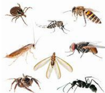
UN INSECTE / DES INSECTES