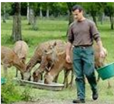
S'OCCUPER D'UN ANIMAL