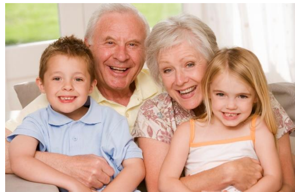
DES GRANDS PARENTS